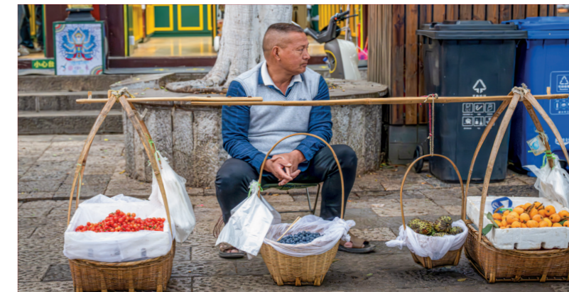
Sus: Un bărbat vinde produse cultivate acasă, pe stradă. Jos: Un fermier se odihnește la un punct de belvedere, în afara unui sat de munte.

„În prima rugăciune l-am cerut lui Dumnezeu o soție