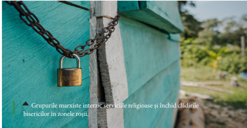
▲ Grupurile marxiste interzic serviciile religioase și închid clădirile bisericilor în zonele roșii.