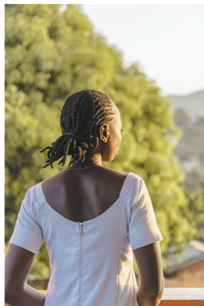
Miracle și-a schimbat numele pentru a onora modul în care Dumnezeu a adus-o din întuneric la lumină.

„Inima mea era fixată pe Domnul Isus Hristos, toată perioada filmului”, a spus ea. „Am început să tânjesc să-mi dau viața lui Hristos chiar