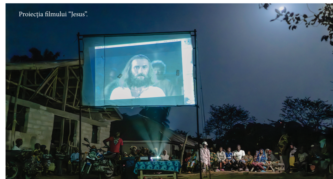
Proiecția filmului „Jesus”.

Ea are încredere în Dumnezeu pentru a continua să lumineze calea înaintea ei într-o regiune a Africii întunecată din punct de vedere spiritual. „Ce mi s-a întâmplat în lumea spiritelor, nu am priceput deplin”, a spus Miracle. „Astăzi însă, pot invoca numele lui Isus și sunt capabilă să înțeleg acel tărâm întunecat dar și lumina lumii. Îl laud pe Dumnezeu pentru că acum sunt cu totul în lumină”.